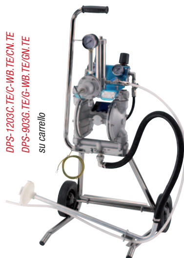
DPS-1203C.TE/C-WB.TE/CN.TE DPS-903G.TE/G-WB.TE/GN.TE su carrello