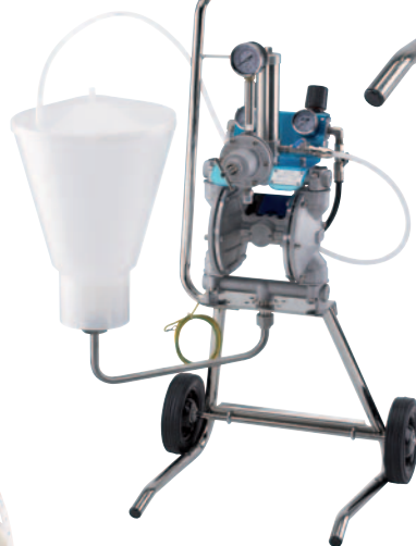
DPS-12036C.TE/C-WB.TE/CN.TE DPS-9036G.TE/G-WB.TE/GN.TE su carrello con tramoggia in plastica (6 lt con filtro 50 Maash)